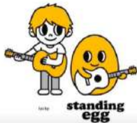
Little star de Standing Egg YATING C.